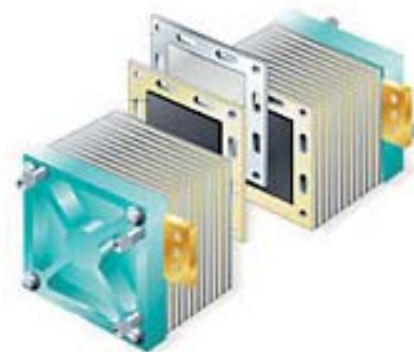
Bild B - Brennstoffzellen-Stapel

Um die Leistung der Brennstoffzelle auf ein vernünftiges Niveau zu bringen, müssen viele separate Membran-Elektroden-Baugruppen